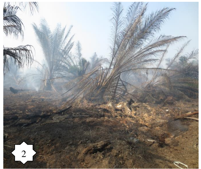
Gambarfoto 1 dan 2 : Menunjukkan kawasan yang masih berasap