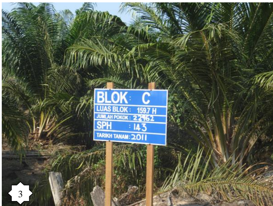
Gambarfoto 3 : Menunjukkan usia pokok kelapa sawit