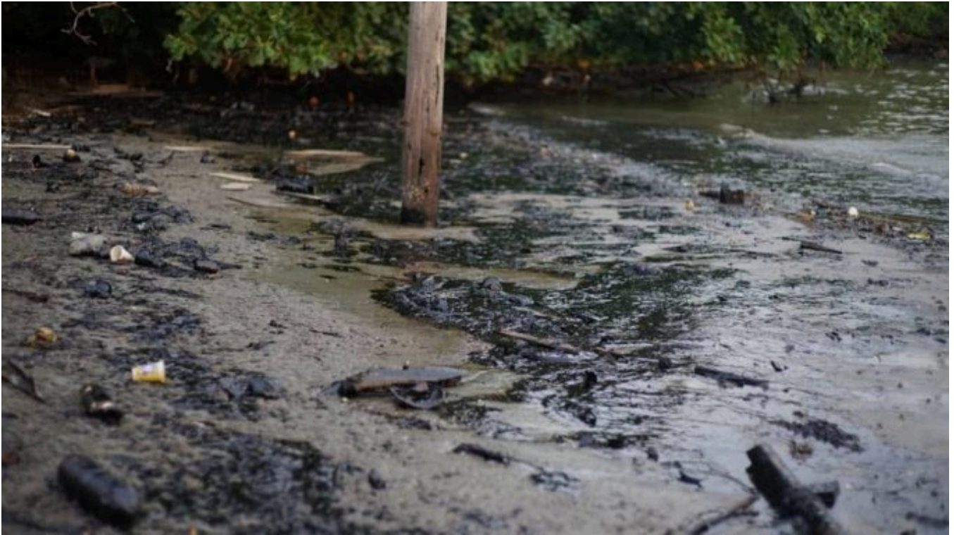
Tumpahan minyak diesel dari Singapura kini merebak ke Pengerang.

Oleh Wartawan MalaysiaGazette - 20 June 2024